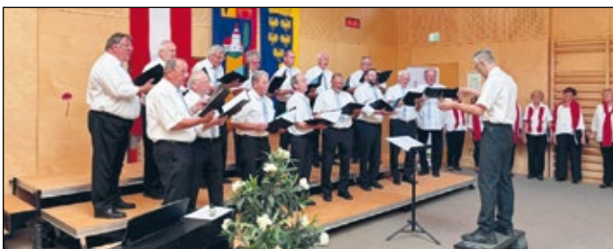
Der Gastchor MGV Thenneberg