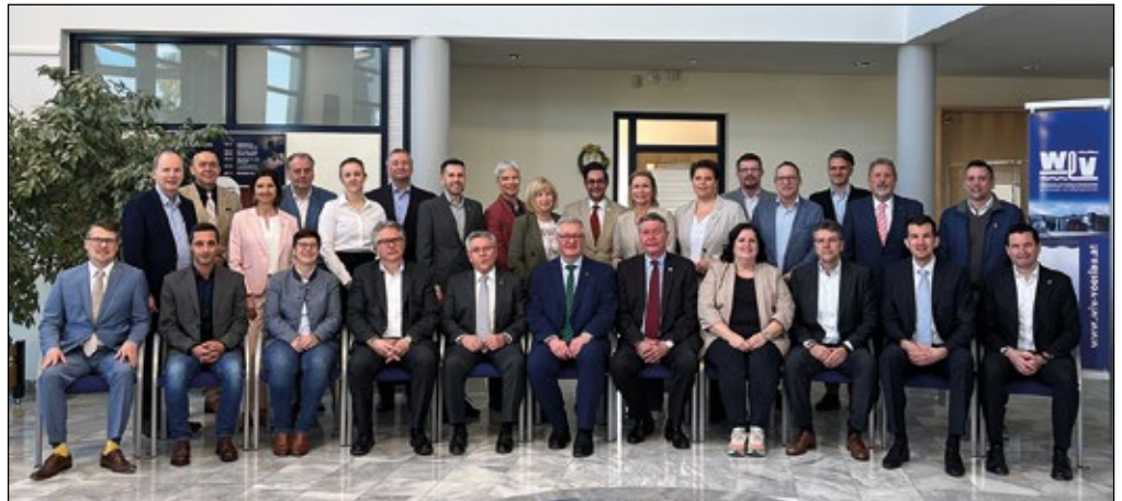
Vollversammlungsmittglieder und auf den Stühlen sitzend die Vorstandsmitglieder